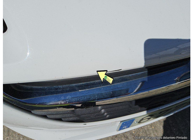
004501 Paragolpes delantero Pintado