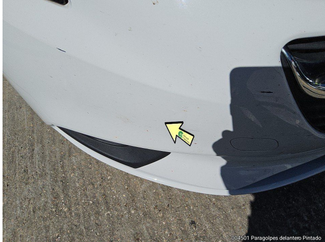
004501 Paragolpes delantero Pintado